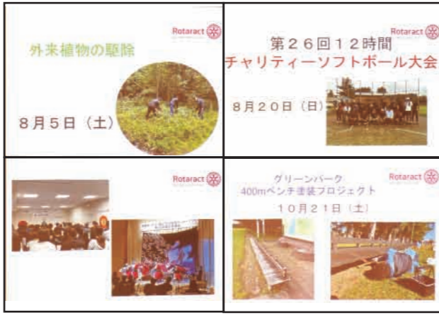
チャリティーソフトボール大会 8月20日

例会案内 月曜日 広尾RC：ホテルむらかみ (12:15) 火曜日 芽室RC：めむろーど3Fレファレンスルーム (12:15) 帯広東RC：ホテル日航ノースランド帯広 水曜日 帯広RC：ホテル日航ノースランド帯広 上土幌RC：上土幌町商工会館 (12:10) 音更RC：ハビオ木野2Fコミュニティホール 木曜日 足寄RC：足寄銀河ホール2F会議室 (18:30) 清水RC：清水町中央公民館 帯広西RC：北海道ホテル 金曜日 帯広北RC：ホテル日航ノースランド帯広