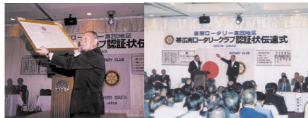
創立10周年記念 (帯広の森体育館へ寄贈)