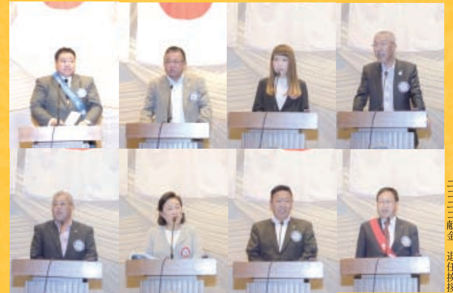
ニコニコ献金 退任挨拶