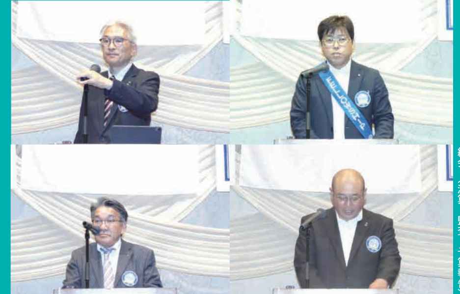
総会 (決算・監査・予算報告)