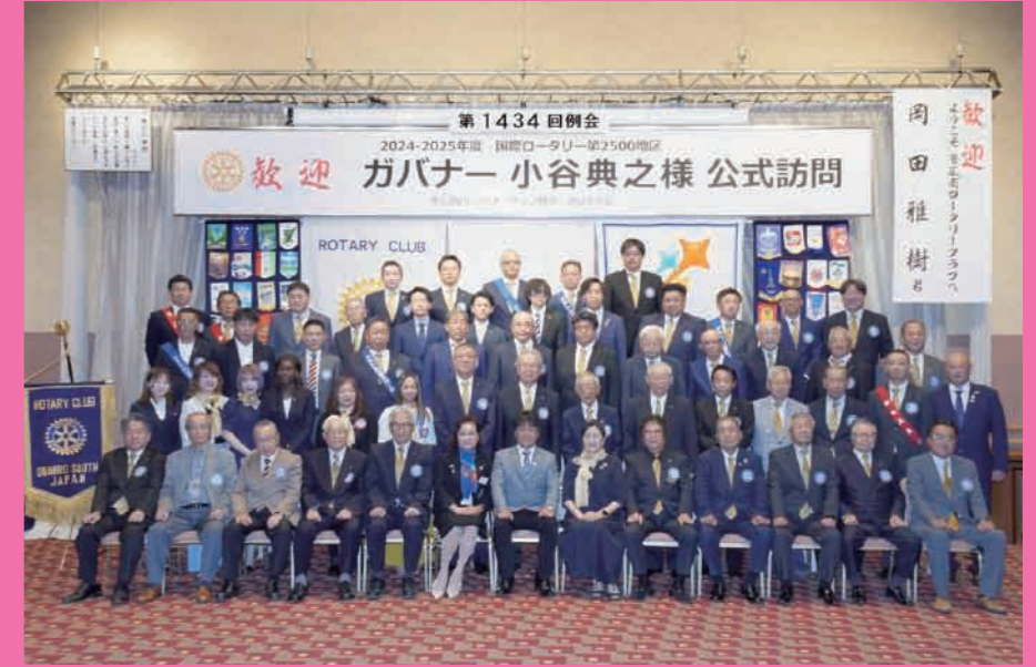
ガバナー公式訪問例会