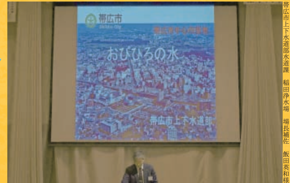
帯広市上下水道部水道課 稲田浄水場 場長補佐 飯田英和様