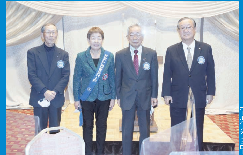
ポルハリスフェロー