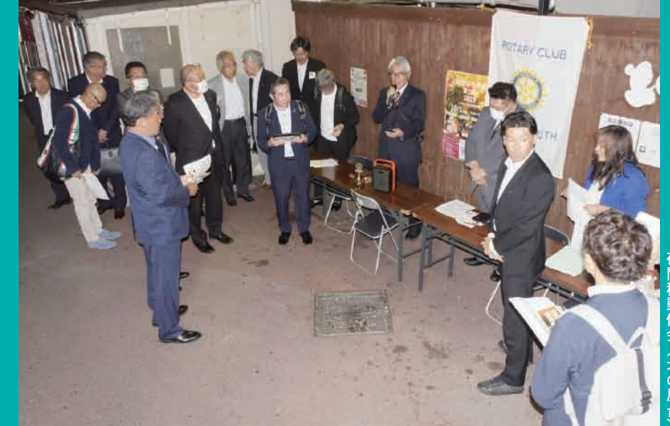
夜間移動例会 (北の屋台)