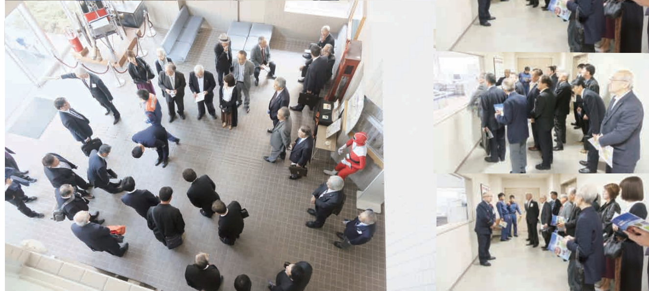
帯広市議会 議長執務室・議会室見学