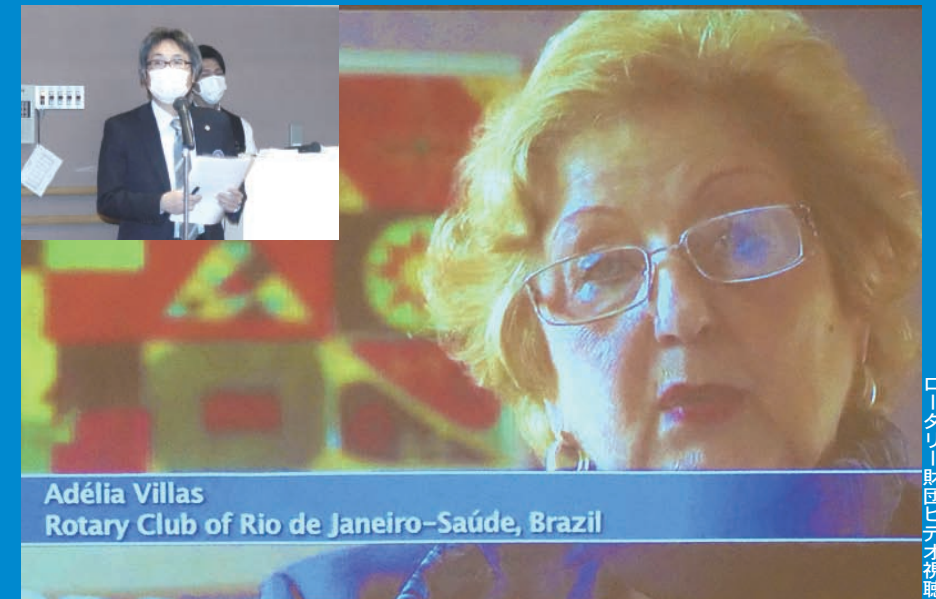
Adélia Villas Rotary Club of Rio de Janeiro-Saúde, Brazil