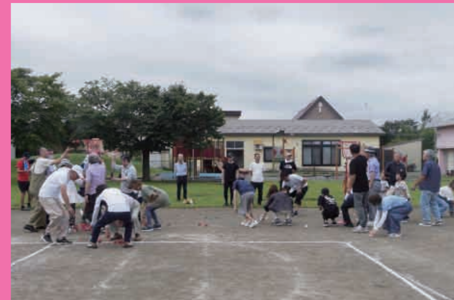
家族野遊会（ひまわり幼稚園）