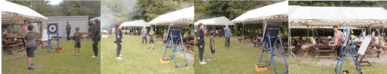
懇親会の写真は後日掲載します

■メイクアップは同年以内 ■例会欠席の場合はSAA又は幹事まで連絡お願い致します