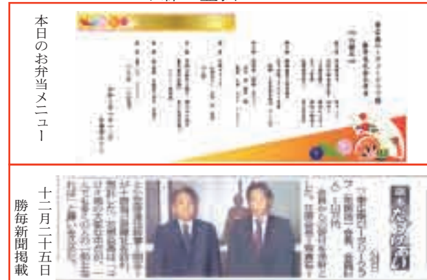
本日のお弁当メニュー 十二月二十五日 勝毎新聞掲載