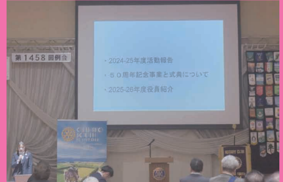
帯広ロータアクトクラブ