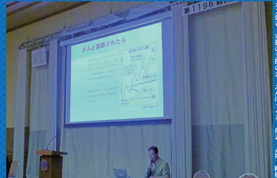
ガン患者・家族の支援の会 えんぼつくる 代表 古城 剛様