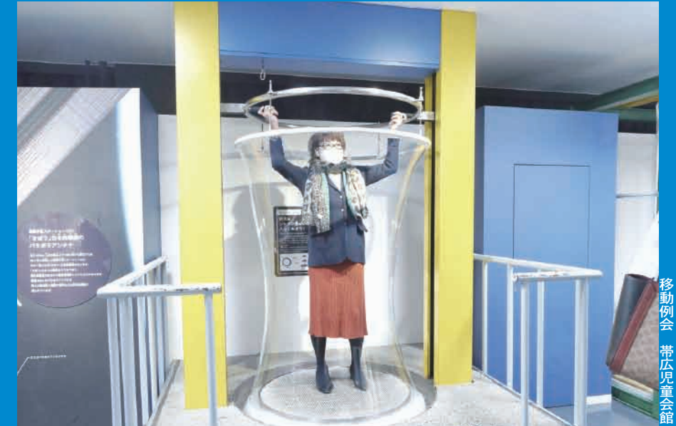
移動例会 帯広児童会館