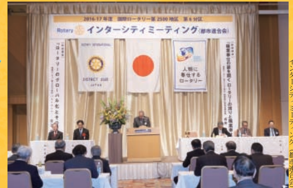
インターシティミーティング(都市連合会)